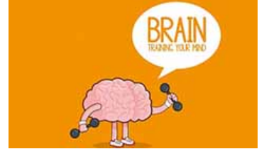
Ginástica cerebral ajuda a preparar para provas