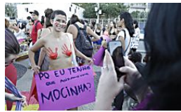
Onda de solidariedade a Luiza Brunet toma a internet e as ruas