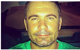
Ex-atacante do Botafogo é espancado em assalto na Zona Sul