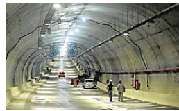
Abertura do Túnel da Via Expressa muda trânsito no Porto