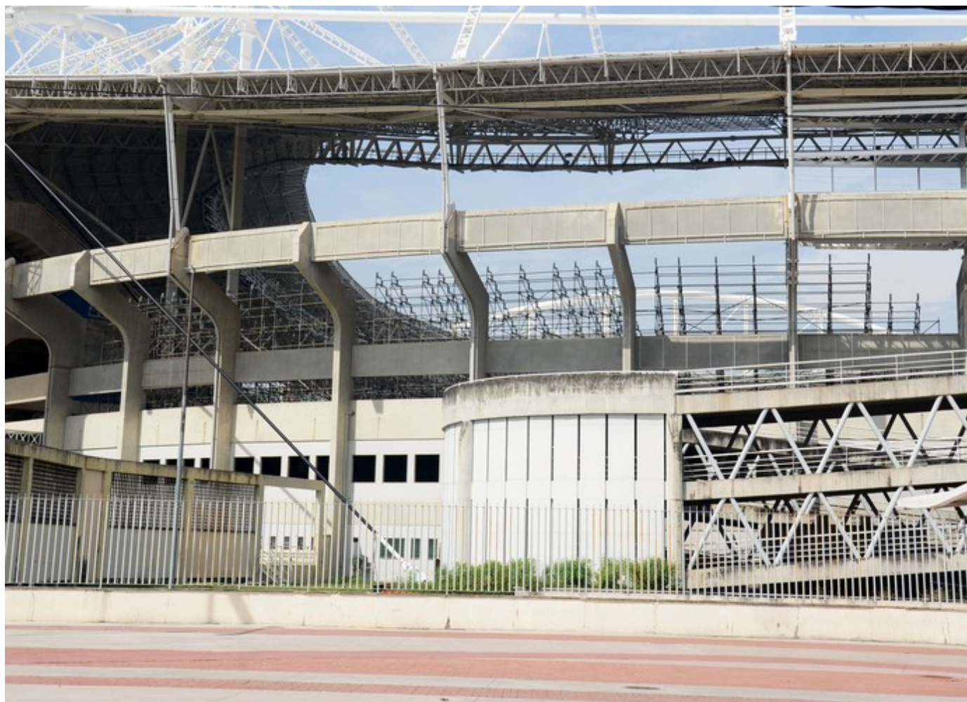
Um esqueleto de como vai ficar a nova arquibancada chama a atenção do lado de fora do estádio