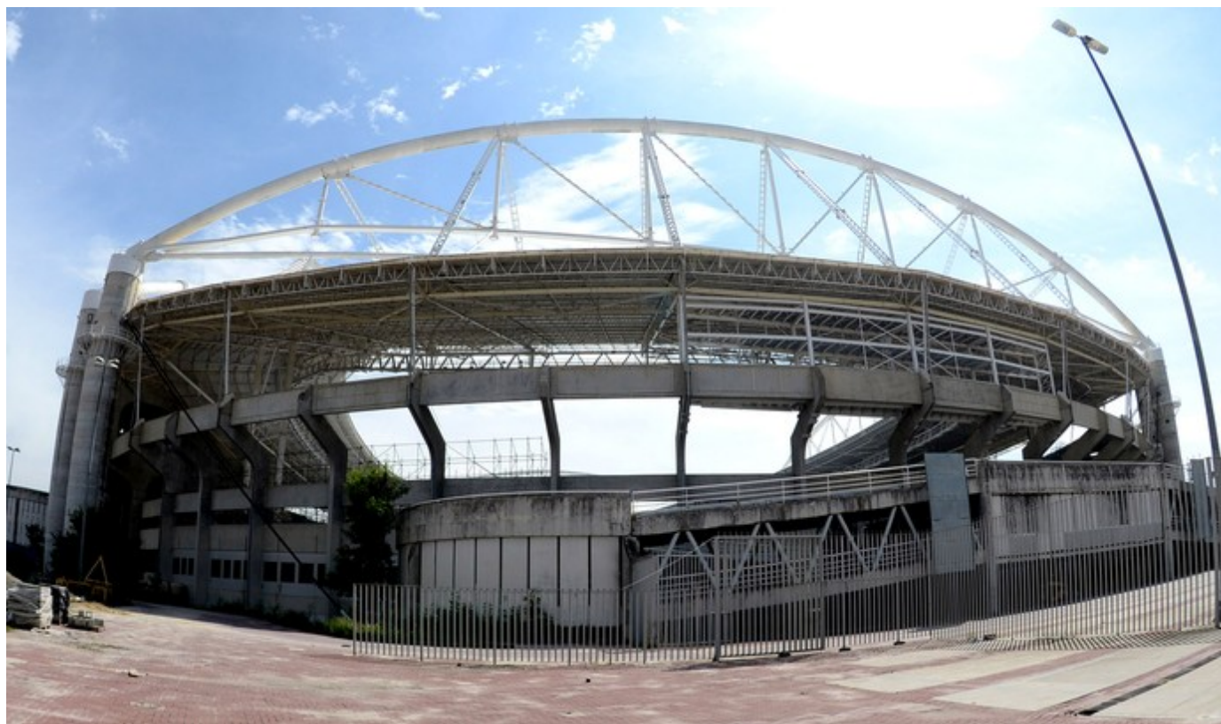
Do lado de fora, é possível notar a arquibancada modular sendo construída à esquerda