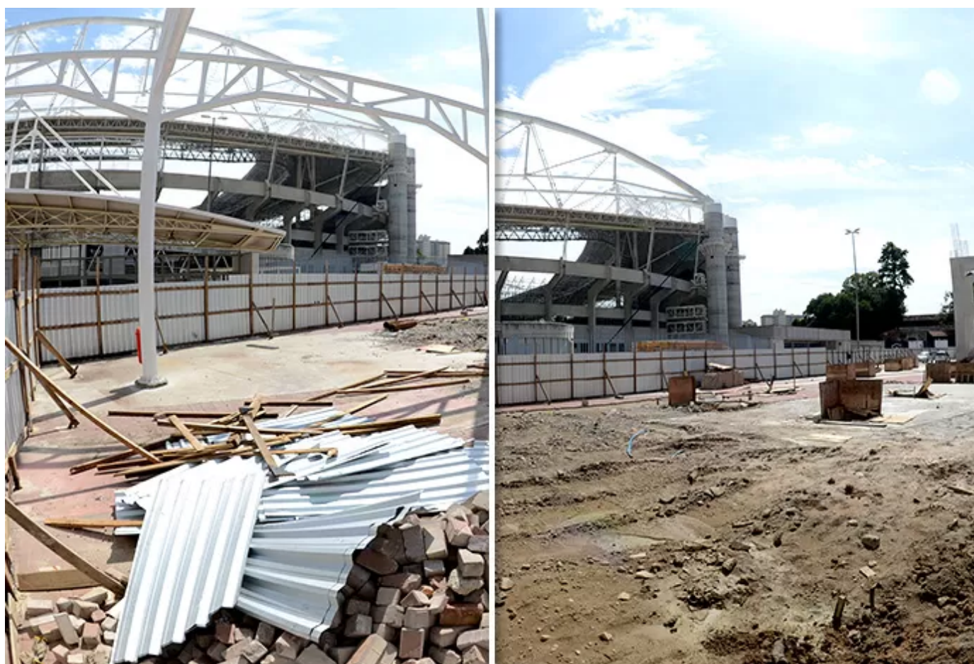
Canteiro de obras: Engenhão vai ganhar nova cara mais uma vez , agora para olimpíadas