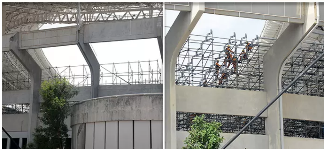
Funcionários levantam estrutura e se preparam para fechar anel superior nos lados norte e sul