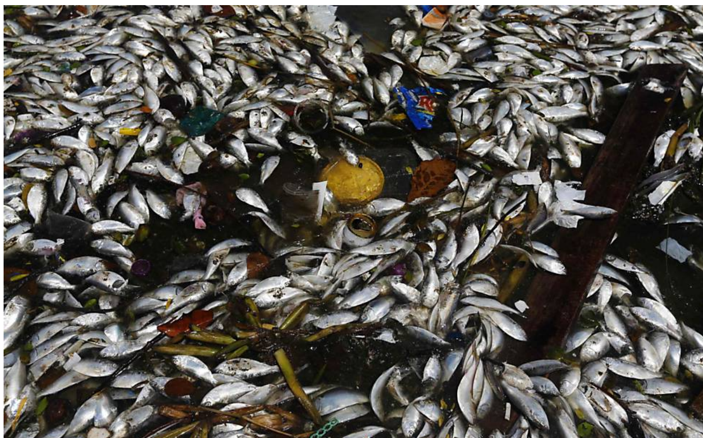
Baía de Guanabara, instalação da Rio-2016 03/08/2014