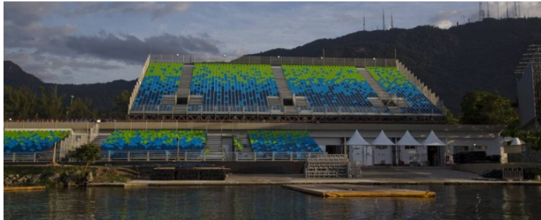
Instalação das arquibancadas provisórias na Lagoa Rodrigo de Freitas: responsabilidade do Comitê Rio-2016

O comitê organizador local dos Jogos Olímpicos do Rio está com um déficit atual de R$ 400 milhões a R$ 500 milhões, de acordo com informações de uma fonte diretamente ligada às finanças do Rio-2016, dadas à agência de notícias Reuters nesta segunda-feira.