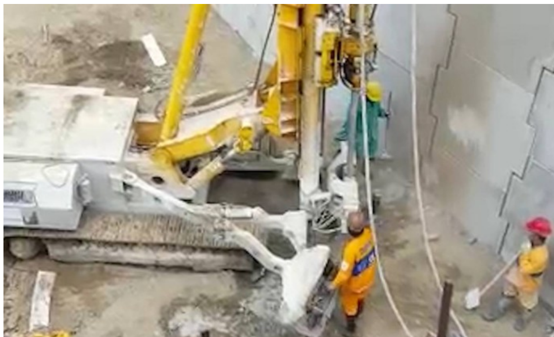
As intervenções ocorrem no aterro que serve de base para sustentar as pistas de um viaduto construído em Curicica - Reprodução

Os problemas no aterro levaram o consórcio construtor a interditar no último domingo — 24 horas após a inauguração — dez casas e três lojas da favela Vila União. Os moradores retirados vão viver pelo menos nos próximos 30 dias em casas alugadas pela empreiteira, no próprio bairro. Durante a fase do projeto, a prefeitura chegou a cogitar remover cerca de 900 imóveis da Vila União localizados nas proximidades do Transolímpico — incluindo as casas que foram interditadas provisoriamente agora —, mas reviu os planos.