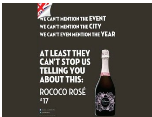
*Londres 2012. A empresa OBBDINS excluiu a referência expressa a marca dos Jogos de Londres, mas ainda assim foi questionada pelo COI.

Nesse sentido, são consideradas infrações aos direitos de exploração comercial pertencentes ao Comitê Olímpico, as mensagens publicitárias com os seguintes apelos, abaixo citados de forma exemplificativa pelo Manual de Proteção de Marcas do Comitê Organizador dos Jogos Olímpicos do Rio de Janeiro 2016, além de outros exemplos práticos verificados no passado.