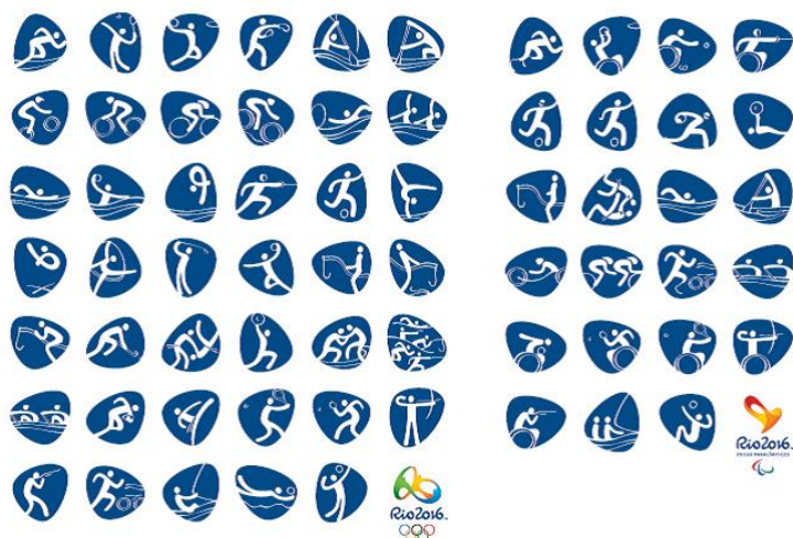
Pictogramas Rio 2016