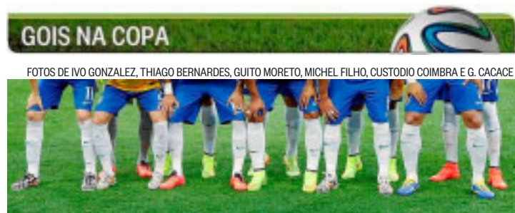
As chuteiras da seleção brasileira: coloridas

Obras começa a construir uma nova avenida dentro da Vila Militar, na Zona Oeste, para fazer a integração do corredor Transolímpico com a estação Deodoro da SuperVia. Com quatro quilômetros de extensão, ela vai margear o ramal de trem, passando por dentro de quartéis do Exército localizados na Avenida Duque de Caxias. TERMINAL DE DEODORO SERÁ LICITADO Orçada em R$ 105,6 milhões, a obra será financiada pelo BNDES e deverá durar 18 meses. Além da nova avenida, o pacote inclui a instalação de nove estações do corredor de ônibus, uma delas dentro da Vila Militar. Desse pacote, contudo, não faz parte a construção do terminal de passageiros que fará a integração com a estação de trem. Segundo a Secretaria de Obras, o projeto ainda está sendo detalhado e será alvo de uma licitação separada. A prefeitura não divulgou os custos do terminal. ●