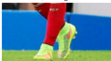
Iniesta, da Espanha