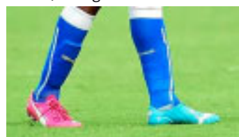
Balotelli, da Itália