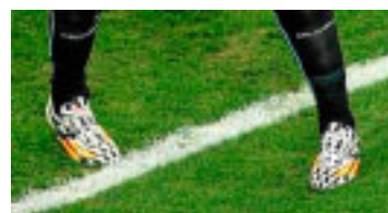
Luis Suárez, do Uruguai