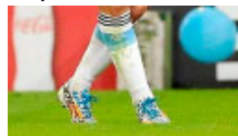
Messi, da Argentina