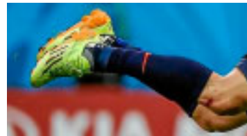
Van Persie, da Holanda