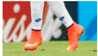
Campbell, da Costa Rica