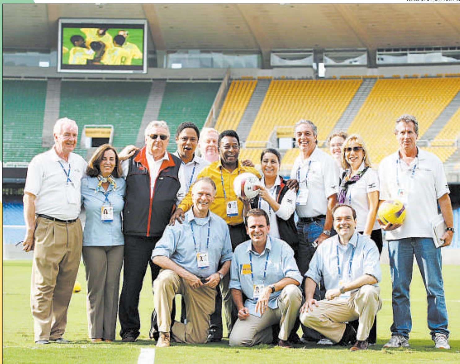
A COMITIVA FOI recebida por Pelé no Maracanã, onde a visita oficial virou tietagem e todos quiseram tirar fotos com o Rei

Tudo parecia conspirar a favor: o sol forte, o céu azul e a água da Baía de Guanabara sem a tradicional mancha de esgoto na altura da Marina da Glória, justamente onde estão programadas as competições de vela. Na estação do metrô da Glória, os membros do COI não viram nem sinal dos mendigos, normalmente nas redondezas. Dois carros da PM e um da Guarda Municipal estavam estrategicamente estacionados a menos de 100 metros da estação.