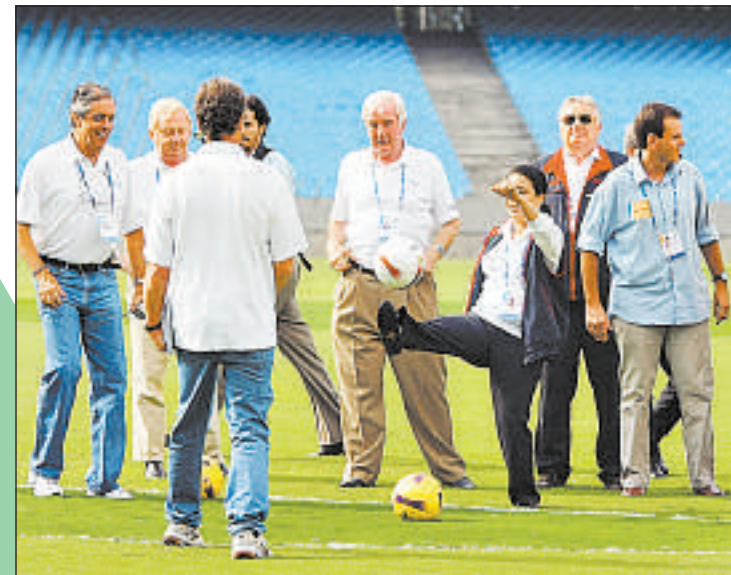
POR FIM, o grupo aproveitou para bater uma bola no Engenheiro