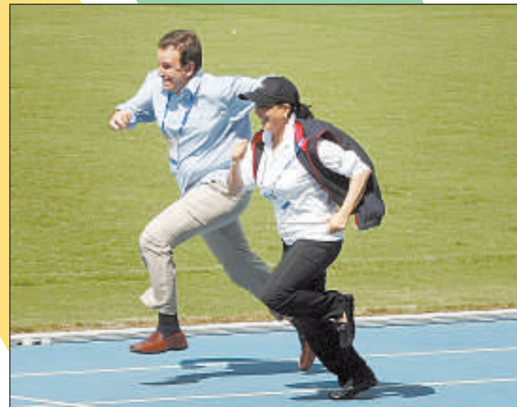
DEPOIS, ele desafiou a presidente da comissão e... perdeu