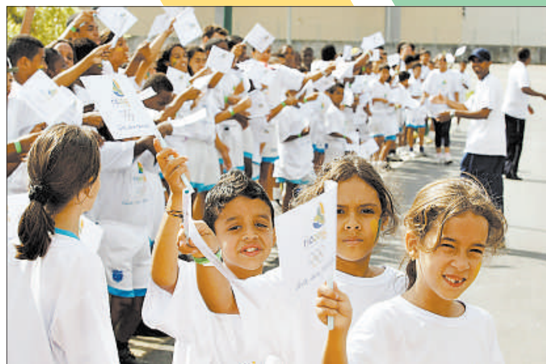
CRIANÇAS FAZEM festa para a comitiva do COI, durante a visita à Arena Multiuso da Barra

Dividido em oito capítulos, o decreto estabelece as diretrizes necessárias à realização do evento, que terá como marca Jogos Rio 2016. As medidas vão da parceria entre os governos federal, estadual e municipal para construção e modernização de instalações desportivas, implementação de planos de proteção ao meio ambiente, segurança, transportes, trânsito e até iniciativas para coibir a pirataria de símbolos das Olimpíadas.