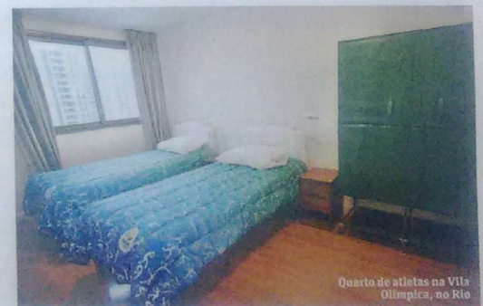
Quarto de atletas na Vila Olímpica, no Rio