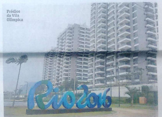
Prédios da Vila Olímpica