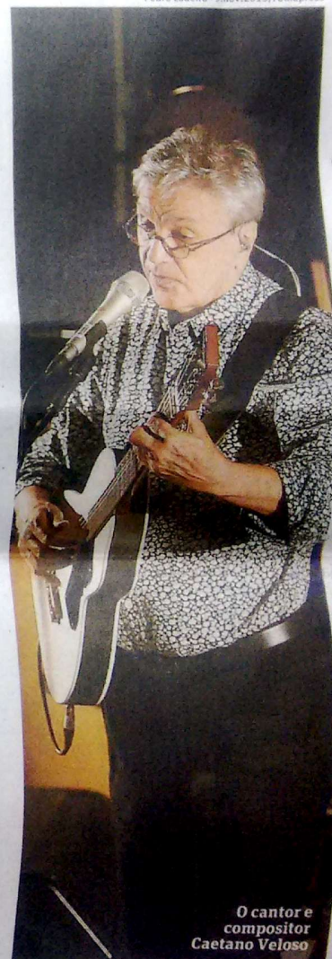
O cantor e compositor Caetano Veloso