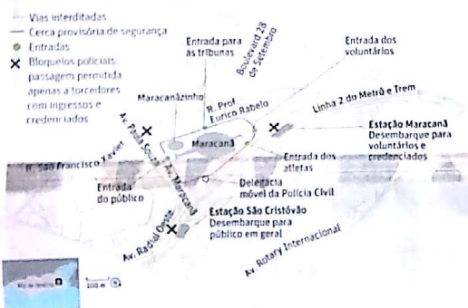
Mapa dos arredores do Estádio de Maracanã