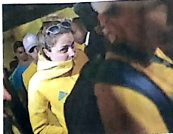
Australianos deixam delegacia no Rio após serem detidos