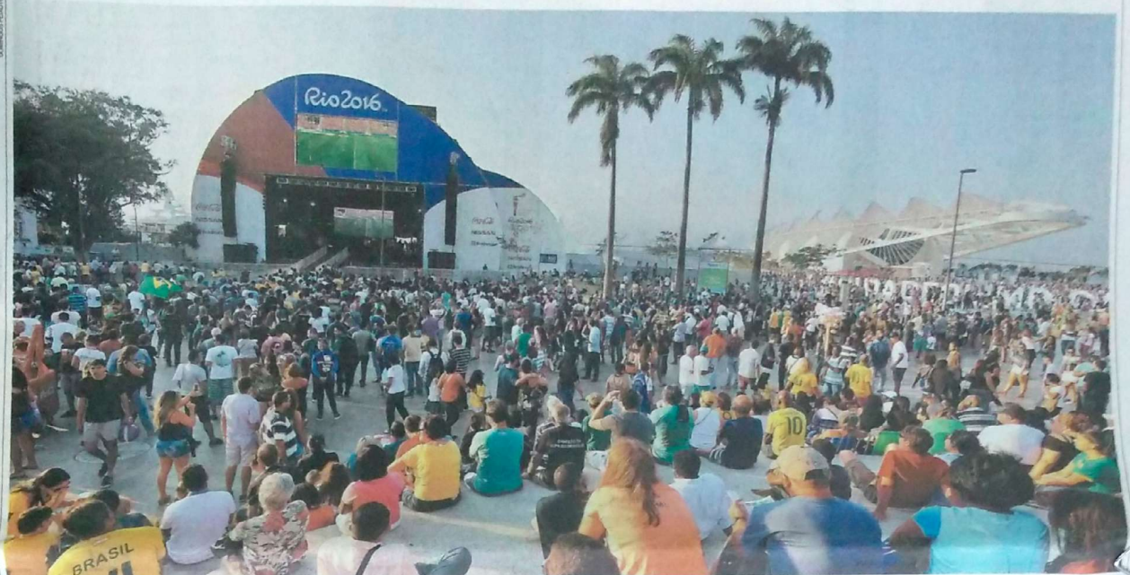
Já no espírito olímpico, Na Praça Mauá, milhares de cariocas e turistas aproveitam o feriado e assistem à estreia da seleção de futebol. Também no Porto foi inaugurada ontem a Casa Brasil, que terá shows e atividades esportivas

Com megaesquema de trânsito e segurança, cerimônia no Maracanã marca início dos Jogos