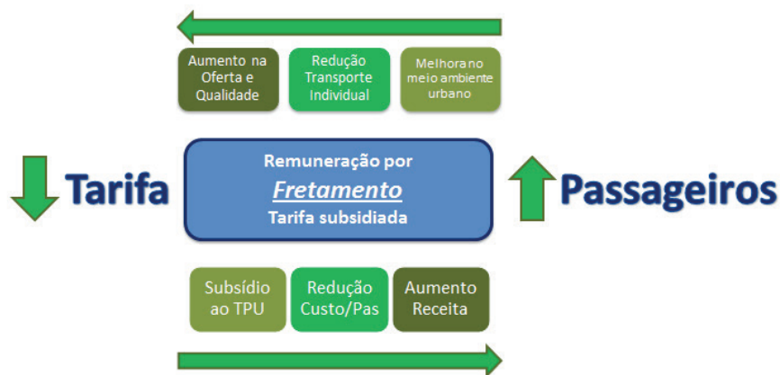
Figura 3: Ciclo virtuoso da regulação por Fretamento

Com maiores incentivos ao modal coletivo público, os custos sociais decorrentes do uso intensivo do modal individual seriam diluídos. Nesse processo, a mudança do modo de remunerar as empresas – no qual o custo é o principal parâmetro – assume um papel central na reversão do ciclo vicioso em um ciclo virtuoso, em que o transporte público será o mais utilizado. Tal transformação pode possibilitar a redução tanto do custo operacional por passageiro quanto, eventualmente, do valor da tarifa.