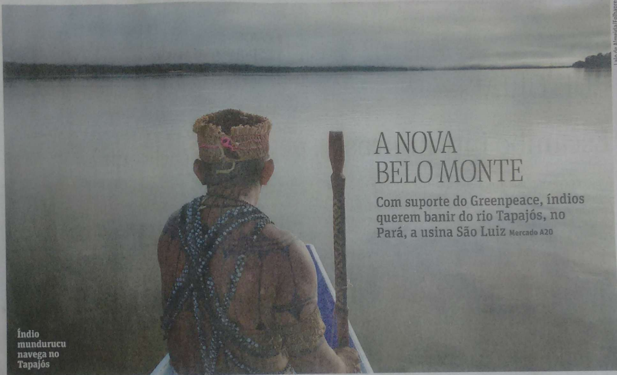
Índio mundurucu navega no Tapajós

O escritor americano de origem romena de origem romena Elie Wiesel morreu aos 87 anos neste sábado (2), em Nova York. Autor de "A Noite", em que relata sua vida em Auschwitz, tornou-se militante dos direitos humanos e recebeu o Nobel em 1986. Mundo A15