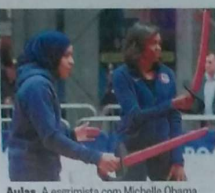
Aulas. A esgrimista com Michelle Obama

porte desde que Donald Trump disse que todos os muçulmanos deveriam ser expulsos dos EUA. Barack Obama, aliás, a citou como um símbolo do apoio aos muçulmanos na América.