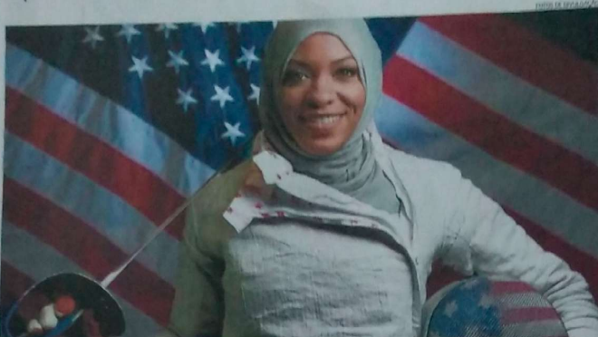
Na luta, Ibtihaj Muhammad: "É um ambiente político difícil esse em que estamos agora, os muçulmanos estão sob uma lente de aumento"

Sobre os Jogos do Rio, diz que tem uma janela ainda pequena no esporte. "Eu só estou tentando fazer o bem", conta. "Esse é o meu plano". Normalmente uma pessoa reservada, Muhammad passou a falar abertamente sobre sua vida além do es-