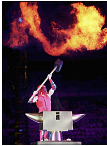
O atleta italiano Yuri Chechi inicia a cerimônia

A cerimônia de abertura combinou coreografia, música e luz, e teve início com um dos mais famosos ginastas italianos, Yuri Chechi, acertando um grande martelo em uma bigorna.