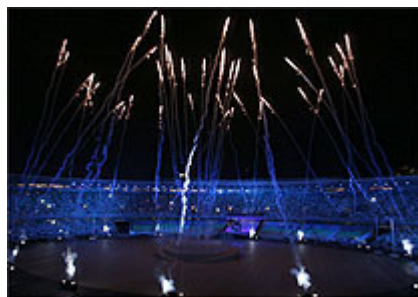
Cerimônia de abertura dos Jogos teve show de luzes e fogos de artifício no Maracanã