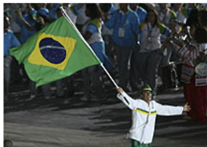
Vanderlei Cordeiro foi o porta-bandeira do Brasil na festa de abertura do Pan do Rio