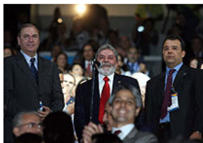
Apesar de vaias, Lula sorri, entre o prefeito César Maia e o governador Sérgio Cabral