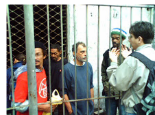
Direitos Humanos comparece em apoio aos ocupantes no direito de ir e vir.