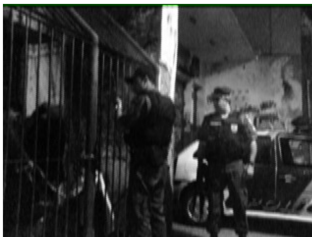
NA MADRUGADA DE 2º DE JULHO, A POLÍCIA MILITAR IMPEDEM OS OCUPANTES DE ENTRAR, SAIR OU ENTRAR ÁGUA E ALIMENTOS NO PRÉDIO.