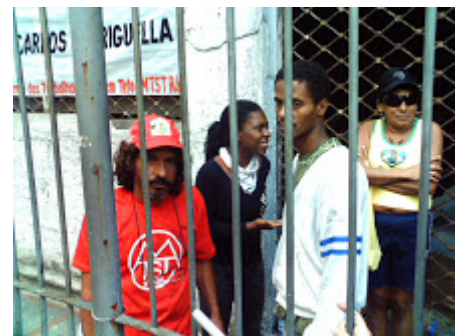
Tensão na frente da Ocupação