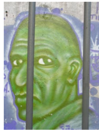
A contribuição do Grupo luta Armada, na pintura do rosto de Carlos marighella