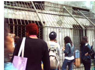
Populares apoiam a Ocupação Carlos Marighella