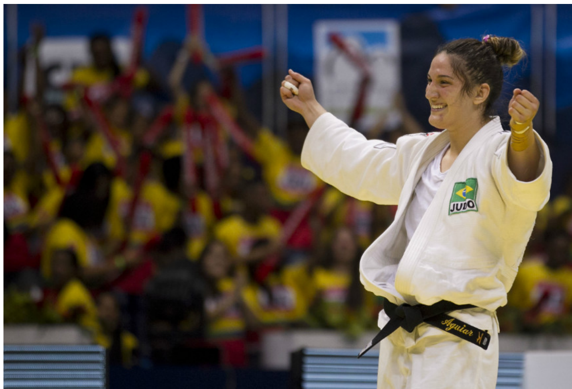
A judoca campeã mundial Mayra Aguiar: aposta do Brasil para 2016