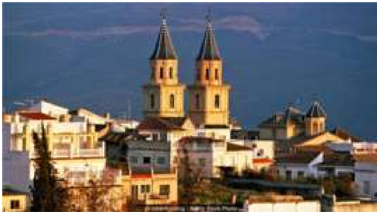
A cidade espanhola que atrai católicos convertidos ao Islamismo