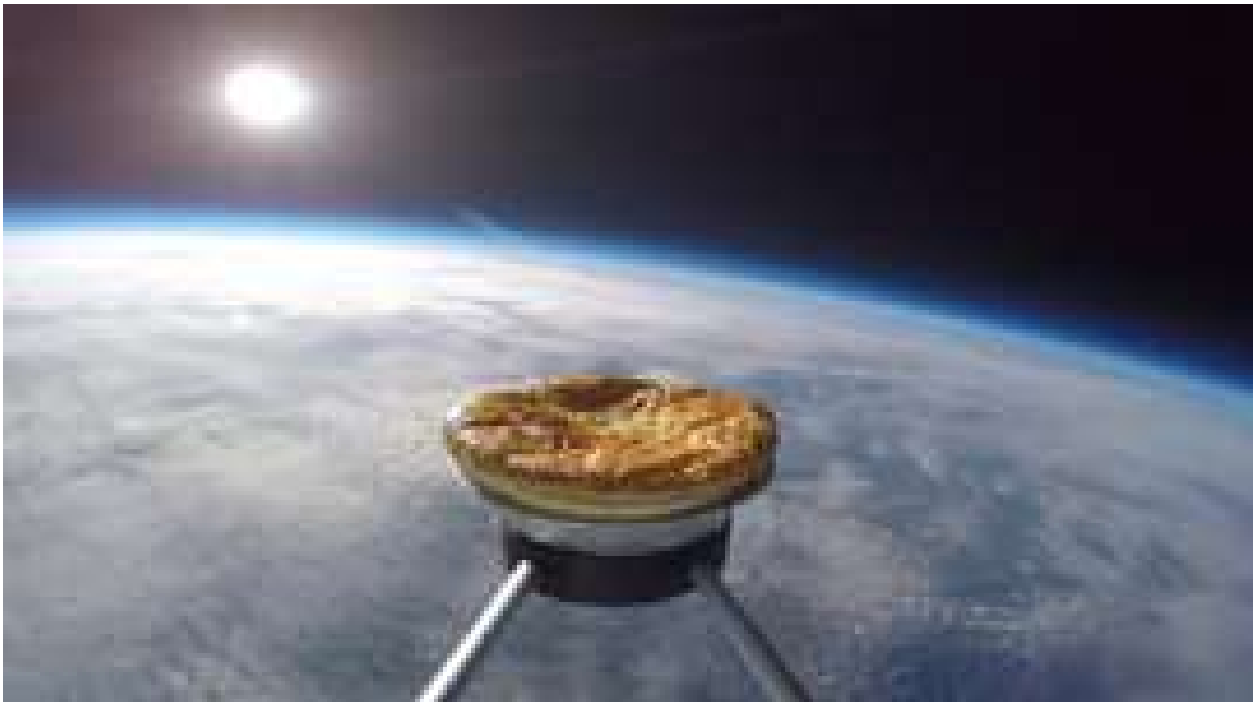
Britânicos lançam torta ao espaço para testar efeitos sobre estrutura molecular