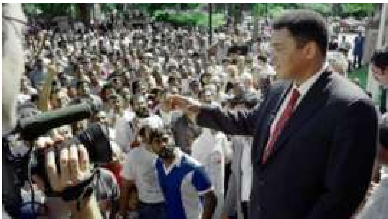
A carta de Muhammad Ali para Nelson Mandela que foi vendida por R$ 30 mil