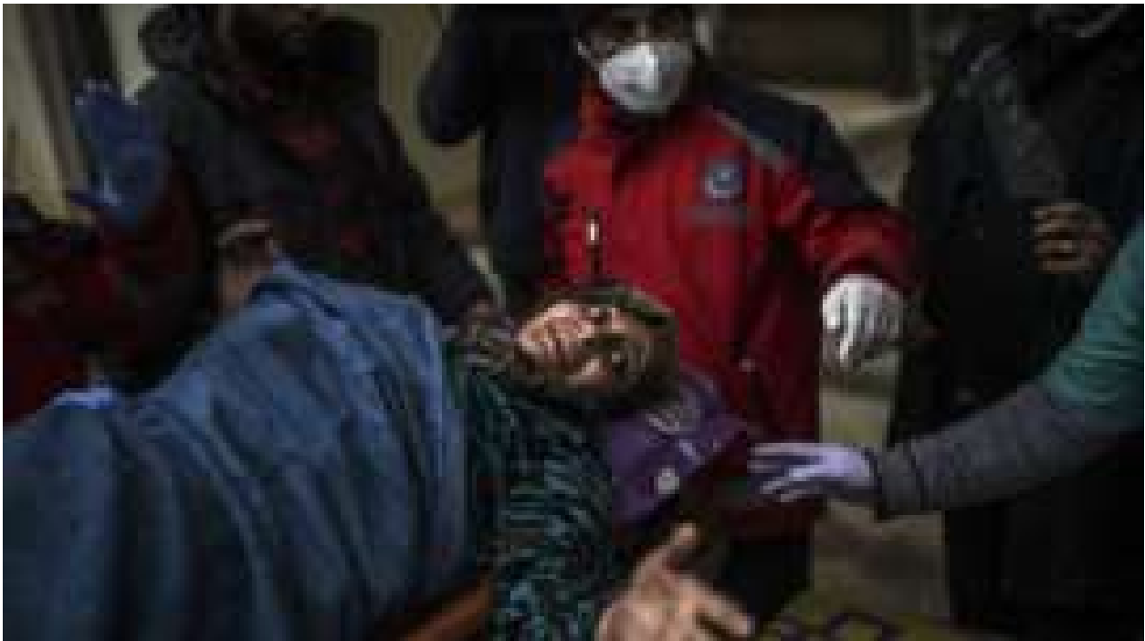
'50 mil estão esperando a morte chegar, prestes a ser vítimas de um massacre em Aleppo'