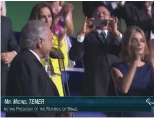
Transmissão oficial da abertura da Paralimpíada chamou Temer de 'presidente em exercício'