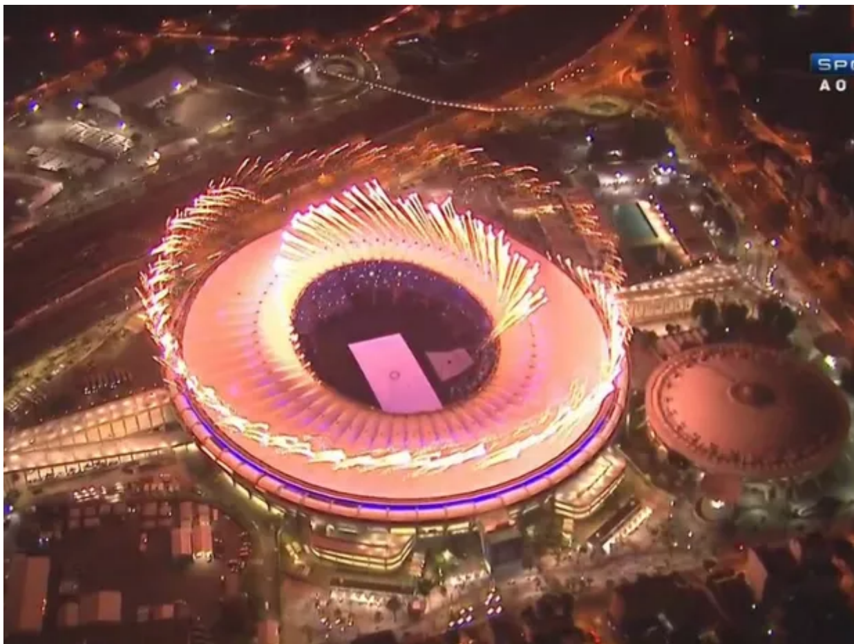
Festa de abertura da Paralimpíada

Outra parte reagiu, aplaudindo e gritando "Fora, comunistas" e "Nossa bandeira jamais será vermelha".