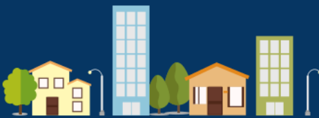
Mais que instalar telefones