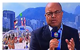
Sungas e biquínis 'minúsculos' dos cariocas chamam atenção de jornal americano