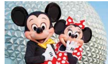
Com dólar mais baixo, é hora de viajar para o exterior