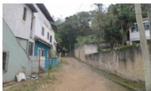
BAIRROS Zona Leste de Niterói pede mais investimentos da prefeitura