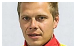
Depois de acidente, médicos lutam para manter técnico alemão vivo