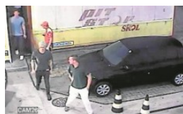
RIO Posto onde nadadores criaram confusão vira roteiro de visita