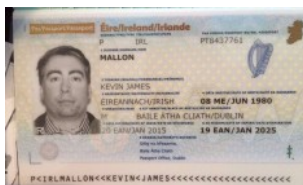
RIO Sem tornozeleira irlandês, preso por cambismo, não sai de Bangu 10