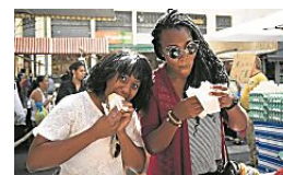
Estrangeiros descobrem hábitos e vivem dias de locais no Rio