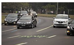
Detran suspende cobrança de taxa por venda de veículos