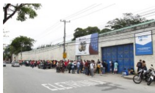
RIO Morre adolescente do Degase com suspeita de meningite