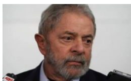
BRASIL Lula diz que 'nem nos piores momentos' imaginou a atual situação